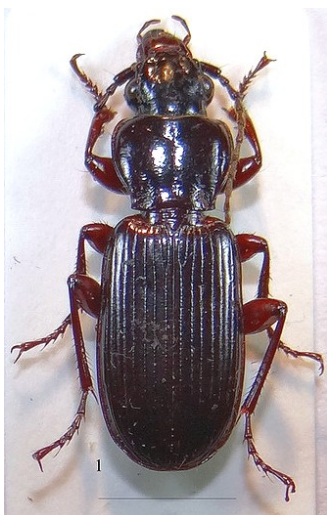
Fig. 1. Habitus de Pterostichus (Adelosia) macer macer (Marshan, 1802) de Areños (Palencia) (Escala 5 mm).

Cabeza (sin contar las mandíbulas) poco más larga que ancha; superficie lisa y con ligero punteado disperso, principalmente en la frente; los ojos son salientes; las sienas muy oblicuas; los surcos frontales superficiales y cortos; el diente del mentón es bifido.