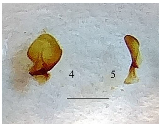
Figs. 4 y 5. Edeago de Pterostichus (Adelosia) macer macer (Marsham, 1802) de Priegnitz (Berlín, Alemania) (Escala 1 mm); 4. parámero izquierdo; 5. parámero derecho.

Edeago con el lóbulo medio muy curvado y con el ápice, en visión lateral izquierda (Fig. 2), largo, afilado, desviado hacia abajo y ligeramente retorcido y, en visión dorsal (Fig. 3), con el ápice terminado en un gancho del lado derecho (el gancho es variable, variando de poco a muy saliente según los ejemplares). Parámero izquierdo (Fig. 4) típico del género y el parámero derecho (Fig. 5) pequeño y en forma de paleta redondeada.